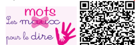
Association "Les maux-les mots pour le dire"