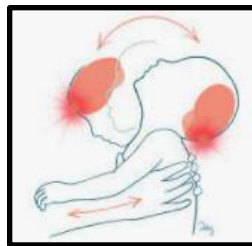
Illustration : Association Stop Bébé Secoué